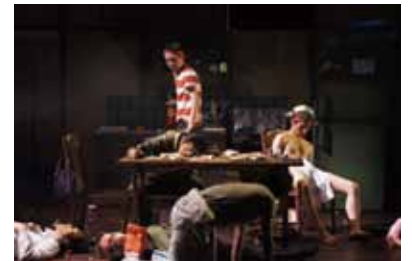
第19回公演「悲惨な戦争」より

制作: 尾崎雅久(尾崎商店) / A級MissingLink 制作協力: 清端理恵子(茶ばしら。)