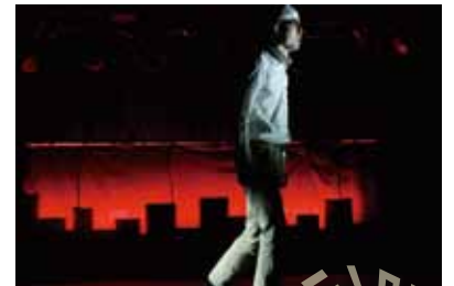
第21回公演「あの町から遠く離れて」より